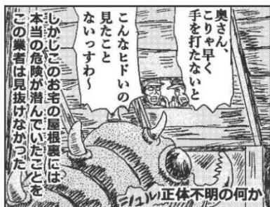
悪質業者は屋根や床下などの危険をことさらアピールし高額な請求をします

「近所で屋根工事をしている」 「無料で点検してあげる」と突然 来訪し、不安をあおって高額な 工事契約をさせる手口がある